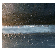
Brez LB 100 tekoče