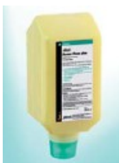
2000ml dozirna plastenka

Aqua, Sodium Laureth Sulfate, Zea Mays, Bentonite, PEG-7, Glyceryl Cocoate, Cocamidopropyl Betaine, Disodium Laureth, Sulfosuccinate, Glycerin, Sodium Citrate, Titanium Dioxide, Parfum, Citric Acid, Xanthan Gum, Propylene Glycol, Butoxydiglycol, 2-Bromo-2-Nitropropane-1,3-Diol, Iodopropynyl Butylcarbamate.