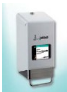
Visokokvalitetno kovinsko držalo